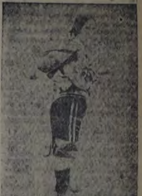
Este pequeño esquimal encuentra cálido refugio en la cabaña que deja caer en su espalda la madre.