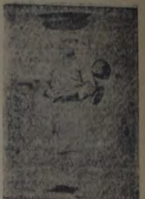
Madre coreana. Mientras vende frutas, el niño, solememente, observa, como queriendo hacer el aprendizaje del comercio callejero.