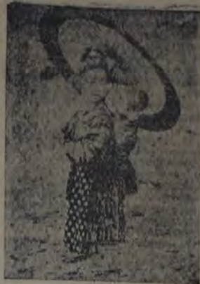
Una joven madre japonesa en su paseo por el campo. Las japonesas tienen profundamente arraigados los sentimientos maternales, de los que hacen un verdadero culto.