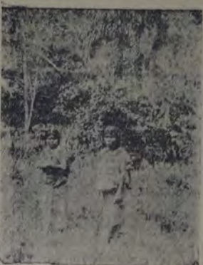
Madres campesinas de Costa Rica, con sus hijos a la espalda, de regreso de las tareas rurales.